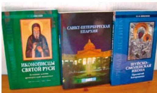
Книги издательств «Троицкая школа» и «Ладан».