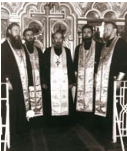
Клир Спасо-Парголовского храма в начале 90-х годов.