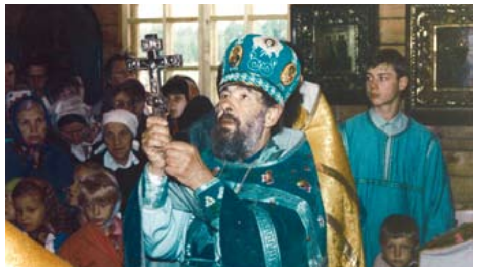
В день освящения Свято-Никольского храма на Северном кладбище Санкт-Петербурга.