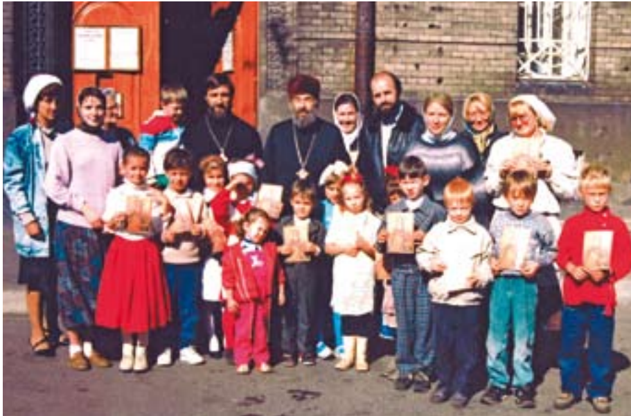
У Свято-Иоанновского монастыря с воспитанниками школы в 1993 году.