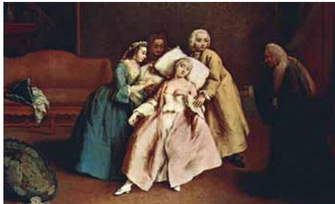
Пьетро Лонги. Обморок.

Пример второй. В храм приходит группа людей. Кто-то хочет креститься сам, кто-то – окрестить своих детей. Священник сначала пытается выяснить, насколько сознателен этот их шаг. Однако в ответ он чаще всего видит не очень-то довольные, а иногда даже изумленные лица людей, торопящихся принять участие в обряде крещения. И в очередной раз убеждается, что они пришли в храм не сознательно, а, скорее, лишь следуя своим эмоциям, повинувшись традициям, устоявшимся мнениям и т.д. Когда же священник предлагает сначала разобраться и понять, хотя бы на элементарном уровне – что такое Православное христианство, что значит таинство вообщем и крещение в частности, иными словами, выйти на сознательный уровень – это чаще всего расценивается пришедшими как нечто, безусловно, лишнее; как чуть ли не попытку вторжения в их личную жизнь. Бывает, доходит и до открытого возмущения: «Вы что, хотите меня сознательно втянуть в вашу религию? Давайте, крестите нас побыстрее и без всяких там ваших лекций!» Фактически человек в этом (далеко не редком) случае добровольно отказывается и даже активно противодействует тому, чтобы его привели в состояние сознания, религиозного сознания, предпочитая оставаться без него.