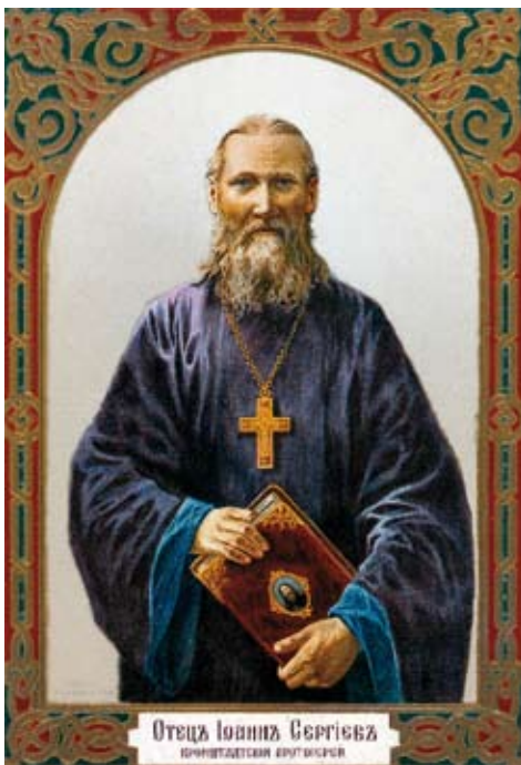
Отец Иоанн Сергеев Кронштадтский Батюшка