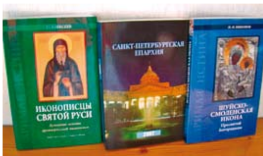
Книги издательств «Троицкая школа» и «Ладан».