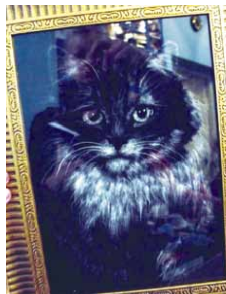
Храм святого Пророка Илии на Пороховых

О народных художниках-умельцах можно сказать многое. Но вот здесь, на стенде мы увидели настоящее чудо. Кот, vyplненный... тополиным пухом на черной бархатной бумаге.