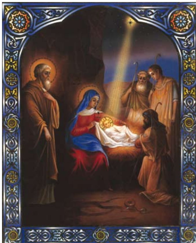
Икона Рождества Христова. Софрино, XXI век

«Все работы хороши! — выполнены от души, Со стараньем и умением, со смиреньем и терпением. А кругом приветствий шум, он ласкает слух и ум,