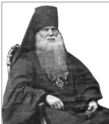
Архимандрит Амвросий Ключарев в 1877 году.

темы и намечал планы будущих проповедей. По воспоминаниям современников, он умел беседовать и находить общий язык со всеми: с представителями Императорской Фамилии и князьями, с учеными, купцами, крестьянами и ремесленниками, так что каждый видел в нем своего. Секрет заключался в том, что он нелицемерно любил Господа, а ради Него и всех людей, данных ему Господом, люди чувствовали, что он интересуется их проблемами непритворно, старается вникнуть в их нужды и заботы, помочь, научить, поэтому все испытывали приязнь к своему пастырю.