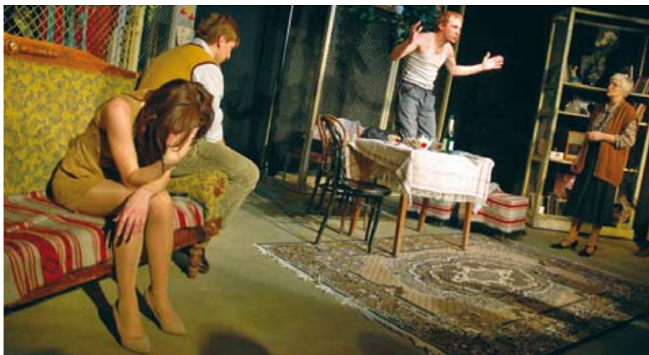
На фото: сцена из спектакля «Дорогая Елена Сергеевна»

Р.С. 3 июня 2009 г в новом Доме Писателя на Звенигородской состоялось предварительное представление романа Людмилы Николаевны Разумовской, известного драматурга. Это первое обращение к жанру «большой прозы» удалось писателю в высшей степени. Прочитанные автором отрывки из романа под названием «Русский остаток» настолько впечатлили всех присутствующих, что выступления с обсуждением романа затянулись намного дольше положенного регламента. Интересно, что у многих участников встречи возникло ощущение личной причастности к услышанному. Кого-то затронула трагедия русского дворянства, другого — проблемы современной семьи, литературными критиками была отмечена связь и преемственность романа с русской классикой, и, конечно же, на всех словно повеяло дыханием великой и трагической истории России XX века, по-новому осмысленной Разумовской с высоты нашего XXI века. Вечер прошёл на большом подъёме, его участники долго не хотели расходиться, ощущая случившееся как большое событие в жизни.