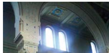
Морской собор, величественный снаружи и таинственный внутри.