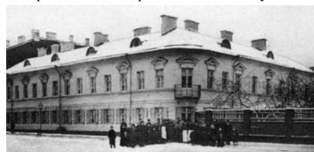
Дом на Посадской улице в начале XX века и в наши дни. В 1960-е годы дом был надстроен, и квартира оказалась разделённой на несколько отдельных квартир.