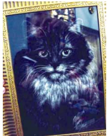
Храм святого Пророка Илии на Пороховых

О народных художниках-умельцах можно сказать многое. Но вот здесь, на стенде мы увидели настоящее чудо. Кот, vyplонный... тополиным пухом на черной бархатной бумаге.