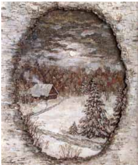
Храм Воскресения Словущего, СПб

Редколлегия газеты «Свеча» Епархиальных курсов религиозного образования и катехизации посетила Рождественскую выставку 2012 года. Мы беседовали с педагогами, художниками, фотографировали мастер-классы, отдельные стенды. Всего, конечно, не охватишь. Но получилось много интересных сюжетов и фотографий.