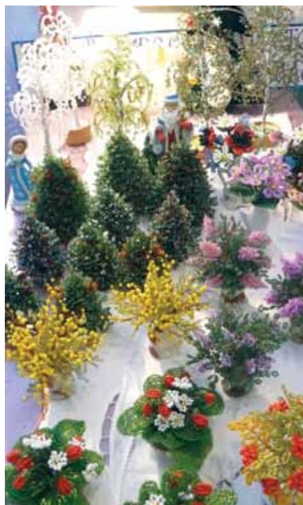
Храм Воскресения Христового (у Варшавского вокзала)

Воскресная школа. Здесь, под руководством педагога и художника, дети выполняют сложнейшие работы по бисероплетению. Мало того, они из бисера делают деревья и цветы. Этот райский сад мы и сфотографировали. Попросили художника назвать свое имя. «Да ни к чему, - мягко улыбнулась женщина. - Ну что тут такого особенного!»