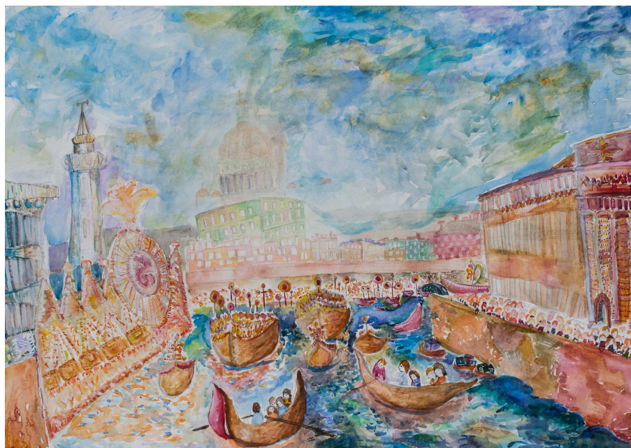
Праздничная иллюминация на Мойке в честь взятия острова