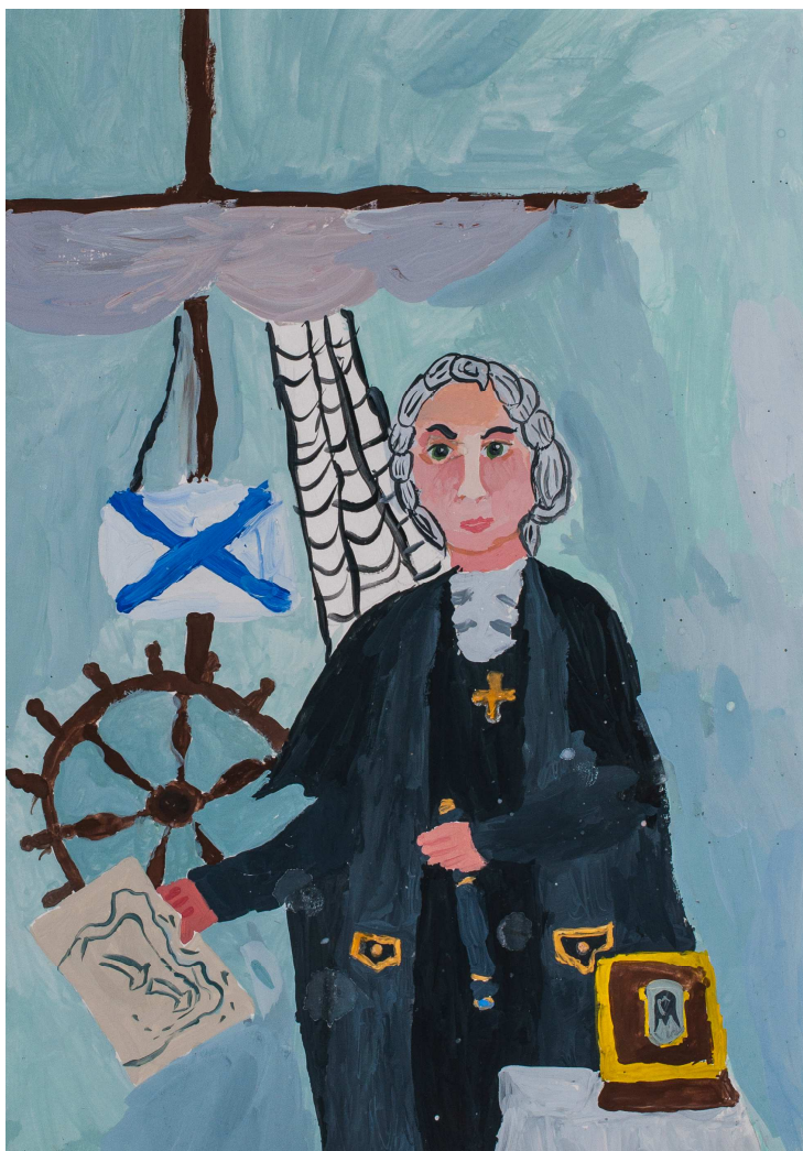
Федор Ушаков – русский флотоводец