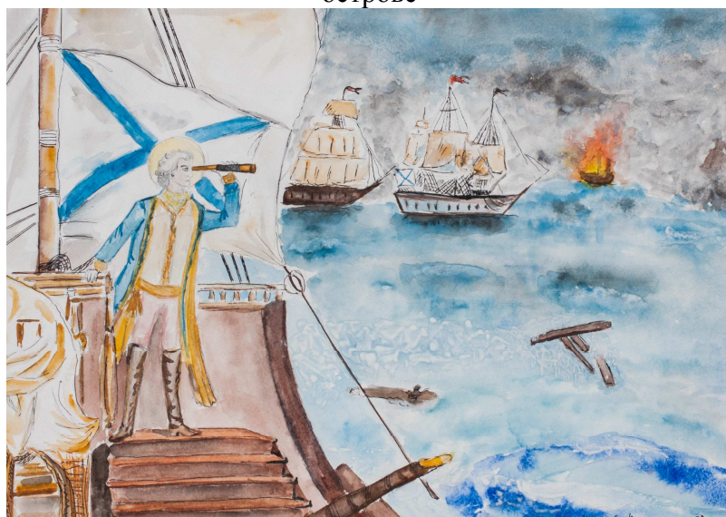
Ф.Ф. Ушаков в бою