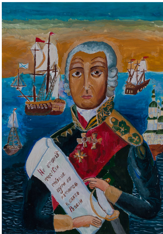
Портрет Федора Ушакова