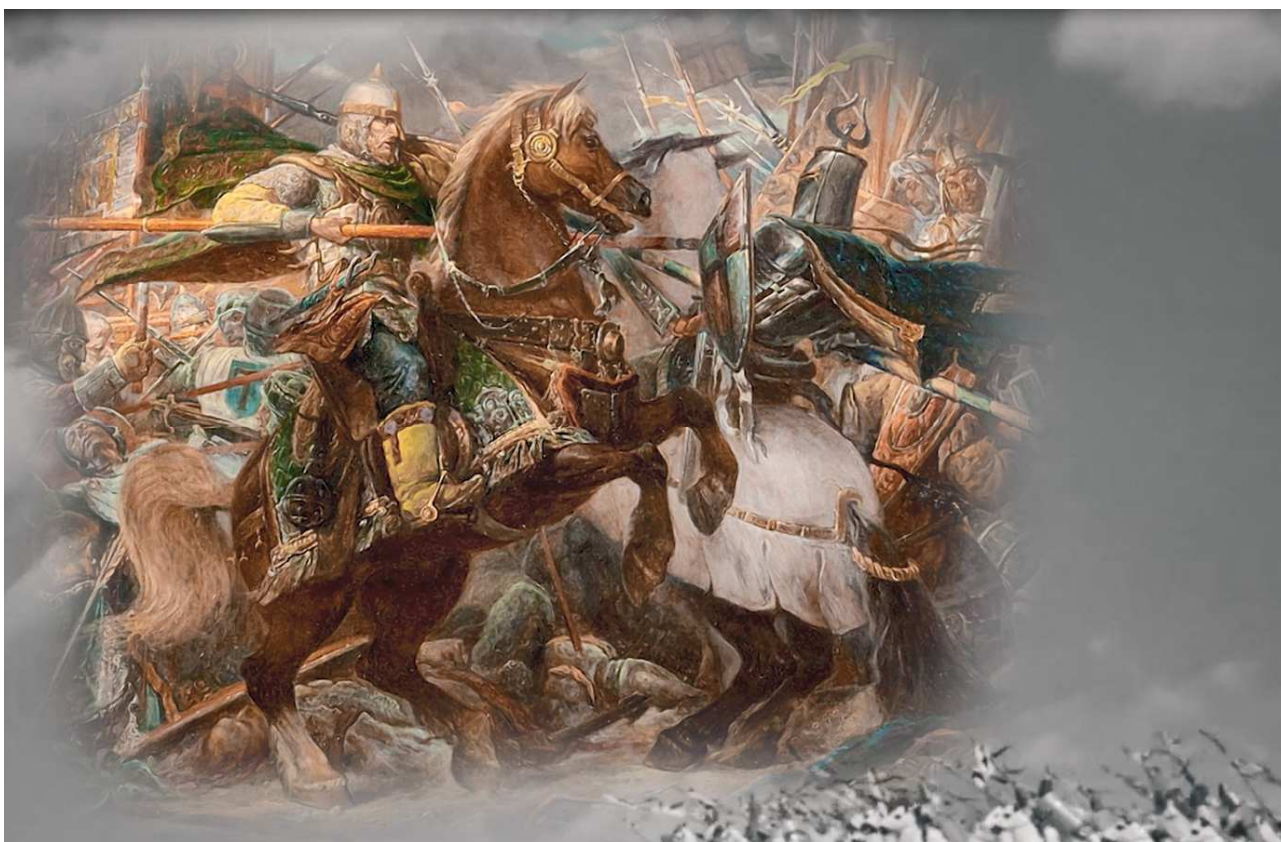
Кадр из фильма с фрагментом картины Д. Костылева «Ледовое побоище»

Насад – в Древней Руси речное плоскодонное, беспалубное судно с одной мачтой и парусом.