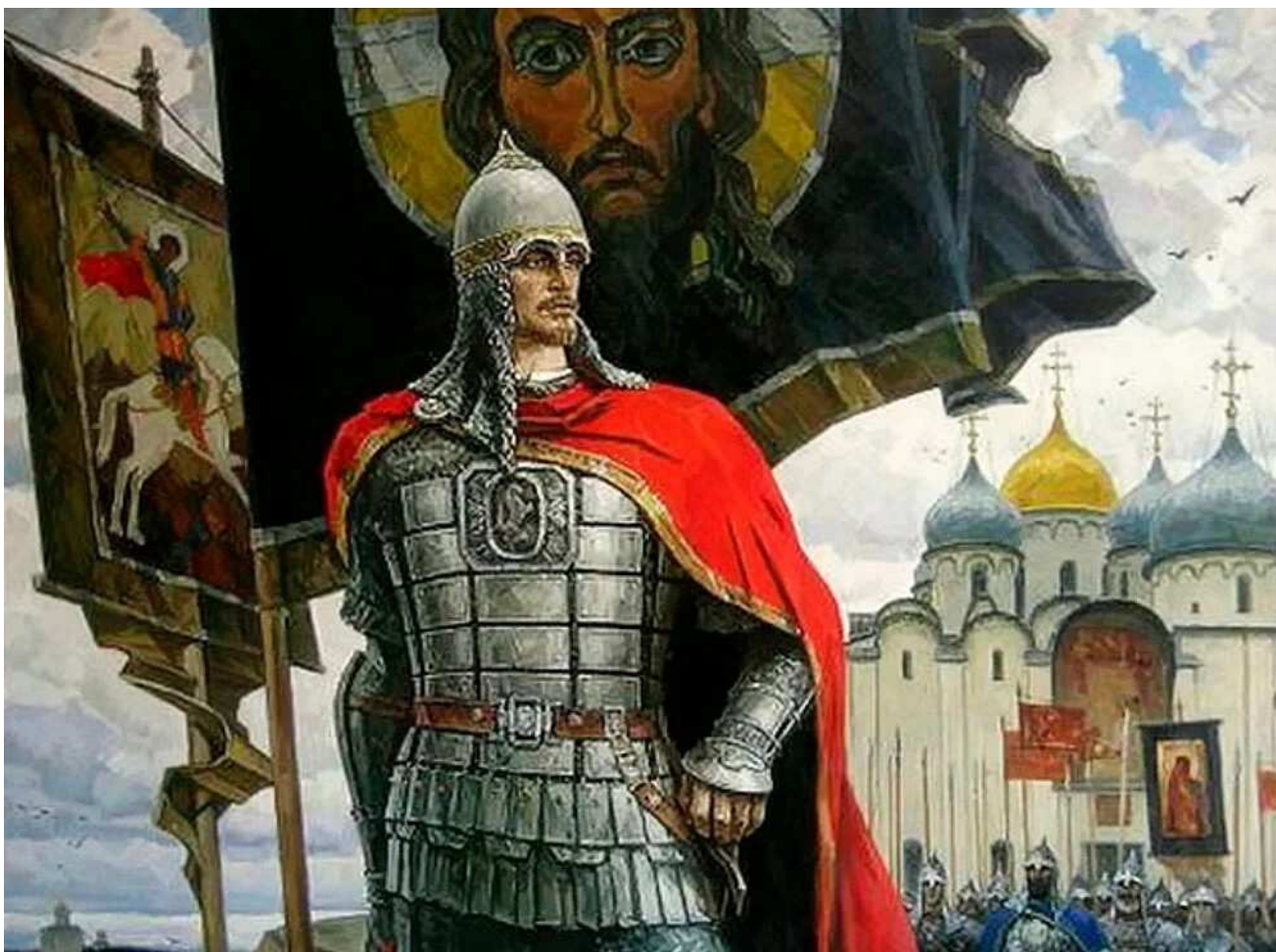
Ю. Пантюхин. Александр Невский

регулятивные : способность организовывать свою деятельность в различных предметных областях с целью интеграции знаний для выбора нравственных ориентиров.