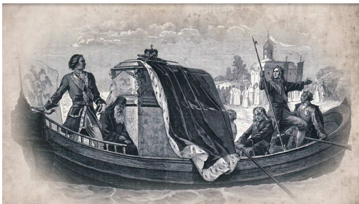
Кадр из фильма с изображением гравюры «Перенесение Петром I мощей св. Александра Невского в Петербург»

Александр Невский. Источники о святом благоверном князе Александре Невском. URL. http://www.a-nevsky.ru/library/index.html