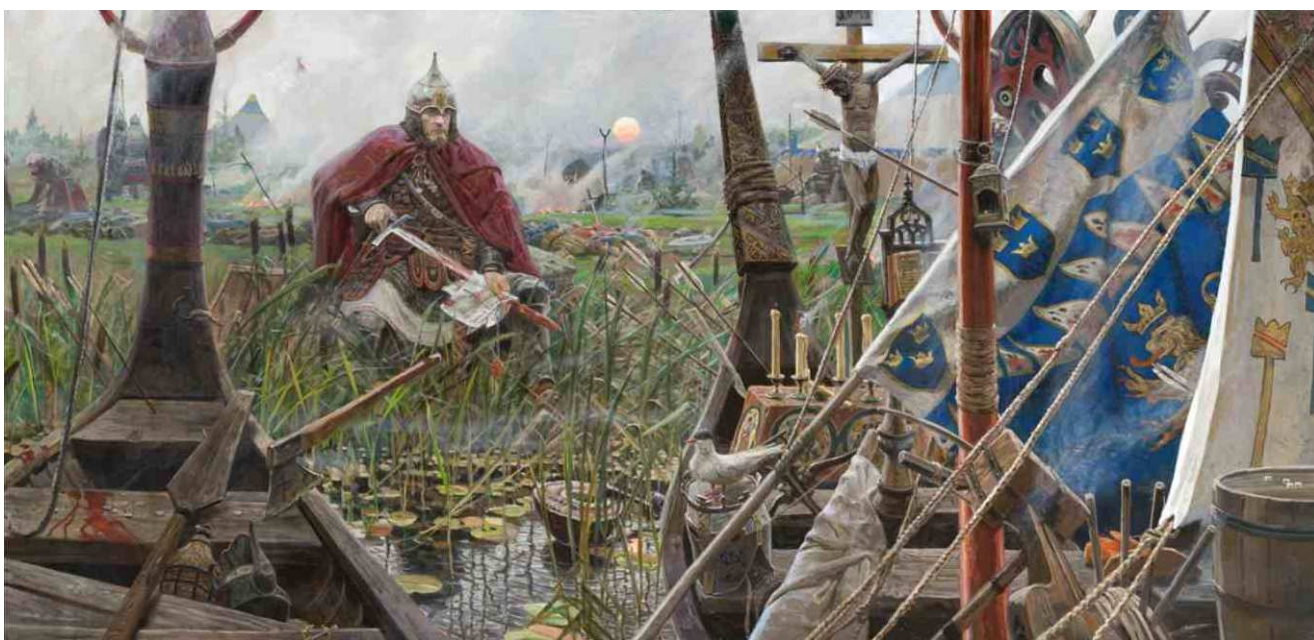
П. Рыженко. Александр Невский – Солнце земли Русской

Литература: навык смыслового чтения житийного текста, распознавать значение метафор и эпитетов.