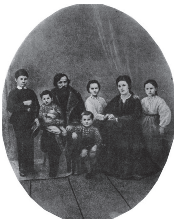
К. Д. Ушинский с семьей. Фото

Константин Дмитриевич Ушинский родился 19 февраля (2 марта) 1824 года в семье мелкопоместного малороссийского дворянина, отставного офицера Дмитрия Григорьевича Ушинского, в городе Тула.