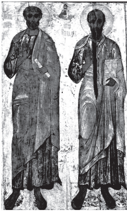
Петр и Павел. XI в. Русский музей

От вечности Бог рассматривал в Своем Уме составленные Им образы мироздания. Эти образы есть Божественные идеи тварного мира. Создавая мир, Бог творит его исключительно по Своей любви и благодати. В творении принимают участие все Лица Пресвятой Троицы. По слову св. Афанасия Великого, «Отец творит все Словом в Духе». Символ веры называет Отца «Творцом неба и земли», говорит о Сыне «Им же вся быша», именует Святого Духа «Господом Животворящим». Бог, творя мир из небытия, создает совершенно новую реальность, вызывает к жизни иную, внебожественную действительность. Икона основывается на самом факте воплощения второго Лица Святой Троицы. Внебожественная действительность, которую икона являет в наш мир, представлена с помощью особого языка, имеющего полное соответствие Евангелию. Этот язык нельзя придумать, это не язык Микеланджело или Рафаэля. Язык иконы — язык Откровения. Откровение становится доступным, когда человек доверяется Богу, становится соучастником сотворения. Начинается сотворение с любви к Богу, с признания Его величия. Но это трудный путь, который предполагает проявление того, что не соответствует нашим желаниям. Икона позволяет нам стать теми, кто примет участие в действии, которое потребует от нас стать чем-то отличным от того, чем мы, по нашему мнению, являемся.