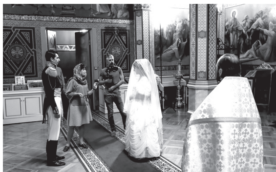
Подготовка к съемке реконструкции «Тайное венчание». Мариинский дворец, храм Святителя Николая. 20.08.2021 г.