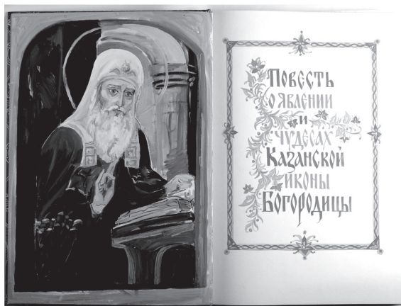
Разворот книги «Повесть о явлении и чудесах Казанской иконы Божией Матери», написанной священником Ермолаем, будущим святым патриархом Гермогеном

Точная дата рождения Патриарха Гермогена неизвестна. По косвенным данным истории полагают, что он родился в 1530 году,