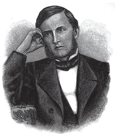
Портрет К. Д. Ушинского. Литография

В основу настоящего труда положены авторские вступительные статьи к выше указанным изданиям.