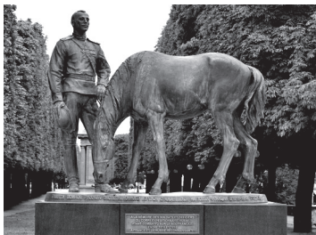
Памятник русскому экспедиционному корпусу в Париже. Франция. (1916 – 1918)

Мы бодро наступали. Отступали. Взят город В., оставлен фольварк Т. Наш эскадронный ранен — не из стали! — На не учтенной штабом высоте.