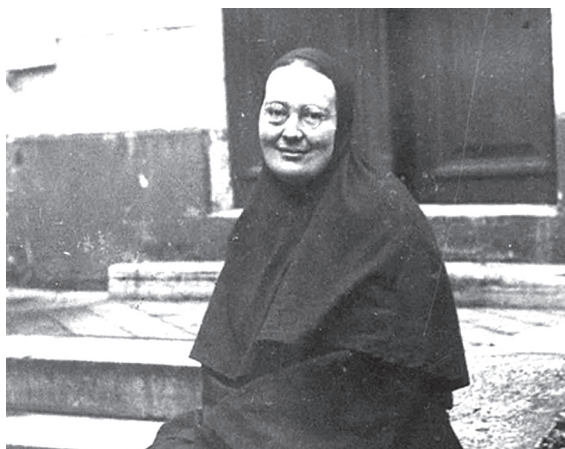
Мать Мария в эмиграции