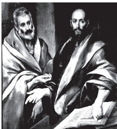
Эль Греко. Апостолы Петр и Павел 1587-1592 гг.

написана около 1587—1592 годов. На картине изображены двое беседующих мужчин, в желтом и красном одеяниях, стоящих возле стола с книгами. Картина иллюстрирует встречу апостолов Петра и Павла в Антиохии, описанную Павлом в Послании к Галатам: «Когда же Петр пришел в Антиохию, то я лично противостоял ему, потому что он подвергался нареканию. Ибо, до прибытия некоторых от Иакова, ел вместе с язычниками; а когда те пришли, стал таиться и устраниваться, опасаясь обрезанных. Вместе с ним лицемерили и прочие Иудеи, так что даже Варнава был увлечён их лицемерием. Но когда я увидел, что они не прямо поступают по истине Евангельской, то сказал Петру при всех: если ты, будучи Иудеем, живешь по-язычески, а не по-Иудейски, то для чего язычников принуждаешь жить по-Иудейски? Мы по природе Иудеи, а не из язычников грешники...» (Гал. 2:11—15). В качестве сюжета художником взят единственный описанный в Новом Завете случай разлада среди апостолов.