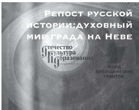
Постер просветительского проекта «Репост русской истории: духовный мир града на Неве»

известную страницу истории создания и дальнейшей сложной, а подчас и драматической судьбы храмов в императорских и великокняжеских дворцах Санкт-Петербурга рождалась концепция цикла телевизионных фильмов, впоследствии получившего название «Путешествие к сердцу дворцов».