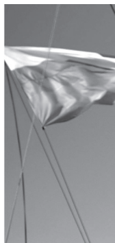
Финальный кадр видеозаставки цикла «Творец новой России. Диалоги о Петре Великом»

в названии серии — «захватчик или освободитель?». И далее — «новатор или консерватор?» в серии об основании Петербурга, «дилетант или просветитель?» в серии об учреждении Академии наук, «критик Церкви или защитник веры?» в серии о церковных