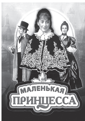
Иллюстрация к работе с фрагментами детского художественного фильма «Маленькая принцесса»

Далее удобно провести работу с фрагментами детского художественного фильма «Маленькая принцесса» и на примере поступков девочки Сары показать, как относился самаритянин к окружающим его людям.