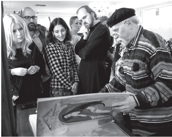
Представление книги «Повесть о явлении и чудесах Казанской иконы Божией Матери», написанной священником Ермолаем, будущим святым патриархом Гермогеном

но дальше от русского престола. Патриарх Гермоген полагал, что Россия может преодолеть Смуту и найти истинного русского монарха, что и случилось в 1613 году с избранием первого царя из рода Романовых — Михаила Федоровича (1596–1645). Святитель проповедовал, увещевал, писал послания с горячим призывом к единству, отказу от личных амбиций, постоять за великую сильную православную Россию. В своих грамотах подвижник обращался и к бунтующим войскам с призывом покаяться, защищать Русскую землю от иноземных захватчиков, подавляя всевозможную рознь.