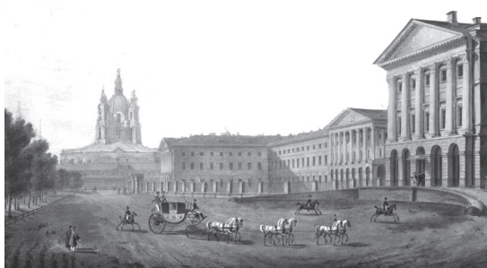
Вид Смольного института. Гравюра. Неизв. художник. 1820-е гг. Эрмитаж