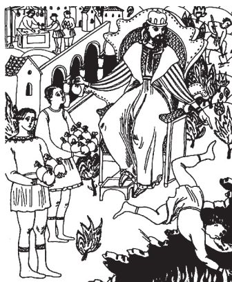
Иллюстрация к работе с притчей о талантах

После подобной работы с иллюстрацией педагог сам может рассказать притчу с помощью передвижных картинок на магнитной доске, которые изображают царя и его слуг. По ходу показа выясняются значения слова «таланты», то есть идет работа над пополнением словарного запаса детей.