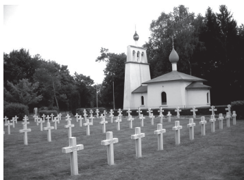
Русское воинское кладбище в Сен-Иллер-лэ-Гран близ Мурмелона во Франции. (Основано в 1916 году)

«Дети Франции... когда вы сможете свободно собирать цветы на этом поле, вспомните нас, ваших русских друзей, и принесите нам цветы» — надпись на одном из памятников Русского воинского мемориала в Сен-Иллер-лэ-Гран близ Мурманона.