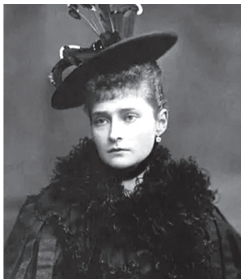
Императрица Александра Фёдоровна (1872–1918)

1. Всё буде помнить Вас — И веер, и бокал, И ясный хризопраз, В колоннах белых зал. Не возвращайтесь к нам — В наш век! Ваш Дом — музей... Приникли к зеркалам Глаза чужих людей. Пустой пладеменаж: В графинчике, на дне, Весь век блестящий Ваш, И смуты наших дней. Вам грустно приходится... Нам — горько осознать... Но есть такая нить, Которой не прервать.