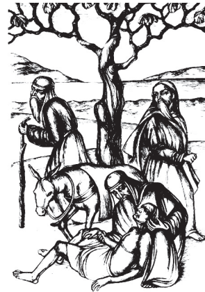
Иллюстрация к работе с притчей о добром самаритянине