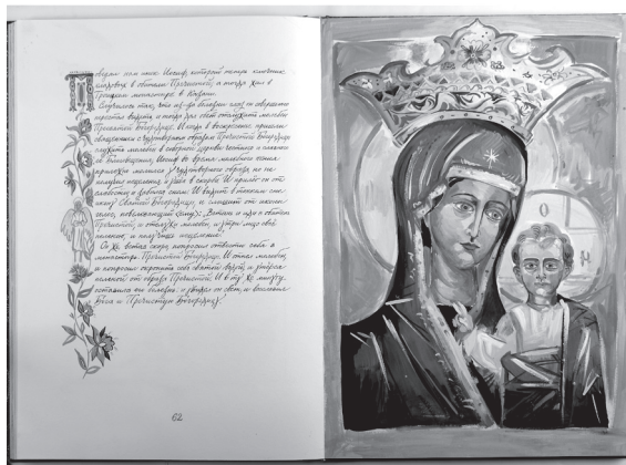
Разворот книги «Повесть о явлении и чудесах Казанской иконы Божией Матери», написанной священником Ермолаем, будущим святым патриархом Гермогеном

истинной наследницы Византийской империи, которая должна была стать Третьим Римом. Конечно, реформа проводилась очень жестко, что вообще характерно для всех русских реформ. Но и Аввакум был человеком далеко не смиренным. И, уважая его личное мужество и несомненные таланты, нужно не забывать, что часто протопоп призывал к действиям, совершенно неподобающим великой заповеди христианской любви. Почему же возник культ Аввакума? Выскажу свое субъективное мнение. Протопопа подняли на пьедестал советские идеологи, считавшие его борцом с самодержавием, героически отдавшим в этом сражении свою жизнь. Но так ли это было в действительности? Рискну утверждать, что ничего общего с социальным протестом или борьбой за улучшение жизни угнетенного народа деятельность мятежного священника не имела. Достаточно напомнить, что любимой духовной дочерью Аввакума была боярыня Федосья Морозова (1632–1675), имевшая баснословные богатства: в некоторые периоды она была богаче самого царя. В их известной переписке протопоп дает Федосье Прокопьевне строгие наставления, но ни разу не приказывает раздать все огромное имение бедным. Думаю, что подобное ему и в голову не приходило. Итак, позволю себе утверждать, что с самодержавием как властью Аввакум и не думал бороться. Ненавидел он конкретного царя — Алексея Михайловича Романова, называя его царем-антихристом. Эта ненависть имела чисто религиозный характер и была