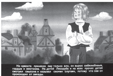
Иллюстрация к работе с фрагментом сказки О. Уальда «Звездный мальчик»

Так, например, рассматривая притчу о фарисее и мытаре, содержание которой незнакомо большинству школьников, педагог может запланировать первоначальное знакомство через рассмотрение иллюстрации и беседу по ней. Такая работа обладает потенциалом использования межпредметных связей с уроками изобразительного искусства и обучает анализу картины, в ходе которого обращается внимание на позы действующих лиц, положения их рук, выражение лиц, обращается внимание и на взгляд, на одежду, а также на интерьер помещения, где находятся герои