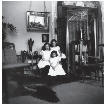
Княжны Татьяна, Ольга и Мария в Кленовой гостиной Александровского дворца. (1905–1906)

В Кленовой гостиной, в Кленовой гостиной, Где счастьем семейным исходят страницы Альбомов и книг, торжествует невинность, И ответ Венцов пал на детские лица, Багряного Рода Княжон — Их Высочеств! На снимках Их трое пока что, и только: Татьяна, Мария... Да как же без отчеств, Коль Честь по Отцу... И, конечно же, Ольга! В Кленовой гостиной, в Кленовой гостиной... Не скоро в ней примут детей коммунаров, С их жизнью несчаст- ной и, точно, недлин- ной, — Охваченной ложью пар- тийных кошмаров.