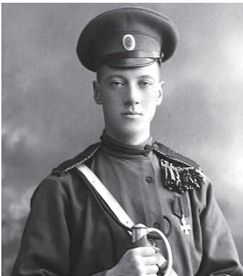
Николай Степанович Гумилёв (1886–1921)

И Святой Георгий, точно, дважды Нашептал у жаркого виска Ту судьбу, что сбудется однажды, Ту судьбу, что странник так искал.