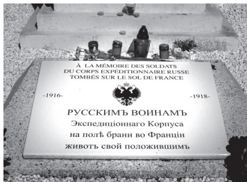
Памяти героев Великой войны (1914 - 1918)

Русской — Чести — Легион, Царский крестник. Что досталось? — Мурманон, С пальмой крестик. В Мурманоне, как в строю, — Под крестами. За Державную свою Вы предстали, Посреди шампанских трав Встав на бруствер... Помни, маленький зуав, Этих Русских! Не забудь, когда сойдут В прах Победы, И не трубы воспоют Напоследок. Их мятежный Петроград Не догонит. На парад — так на парад В Мурманоне. Под кресты — так под кресты! Краше строя Может быть лишь монастырь С аналоем. Выше Чести — лишь Любовь... Лучше боя Может быть смертельный бой За Святое. И достался Мурманон, С пальмой крестик... Русской — Чести — Легион, Царский крестник. И в семнадцатом году Наступали... Русский жертвенный редут Отстояли!