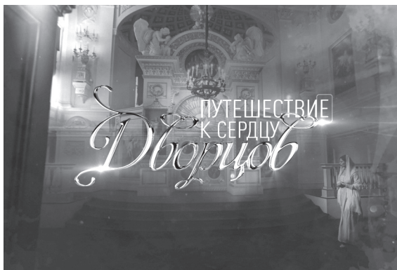
Финальный кадр видеозаставки цикла фильмов «Путешествие к сердцу дворцов»