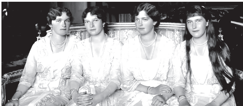
Великие княжны Ольга, Татьяна, Мария, Анастасия Романовы. 1916 год

За стеклом — мундирные платья, Но исходят от них Лучи!.. Под Виссоном — тонкость запястья, Под Венцами — Ангельский Чин!