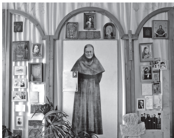
Мемориальный зал «Возвращение на родину», который посвящен матери Марии (Скобцовой) в Анапском археологическом музее-заповеднике «Горгииппия»

тице (Эстония). Её доклад на этих Третьих Пюхтицких чтениях 11-12 декабря был о Матери Марии и дословно назывался: «Социальное служение, дела милосердия Матери Марии (Скобцовой), их отражение в жизни российских современников». С тезисов этого доклада, присланного нам в ноябре 2014 года перед поездкой в Эстонию, тогда и началось наше заочное знакомство.