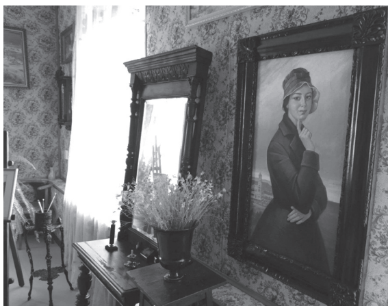
Мемориальный зал «Возвращение на родину», который посвящен матери Марии (Скобцовой) в Анапском археологическом музее-заповеднике «Горгиппия»

нием к теме Матери Марии и привёл её на святую землю – для занятий с детьми. Приведу строки из её скупой информации: «В пасхальные дни были с детьми приюта с их учительницей, и с вифанскими сестрами, конечно, в Гефсиманском монастыре. Помогали чем могли. Дали мне удивительное послушание в суббо-