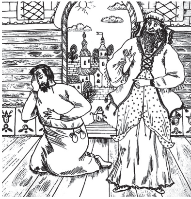
Иллюстрация к работе с притчей о фарисее и мытаре

Иллюстрация к работе с притчей о мытаре и фарисее желательнее рассказать детям, что такое притча. Для чего Христос говорил притчами с народом? Рассмотреть содержание притчи о фарисее и мытаре. Кого называли фарисеями? Кого называли мытарами? Что для нас поучительного в этой притче? Также приводим примеры литературных героев из художественной литературы, напоминающих своим поведением фарисея и мытаря. Были ли такие случаи, когда вы поступали как фарисей? Хотелось ли вам иметь такого друга, который был бы похож на фарисея? Почему? Не ведем ли мы себя по отношению к другим как фарисеи?