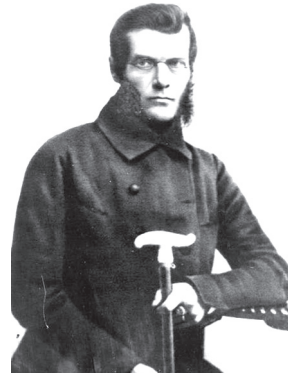
И. В. Киреевский (1806 – 1856)

Ключевые слова: типологическое своеобразие русской философии, внутренняя цельность личности, святоотеческое наследие, верующий разум.